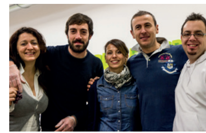
Un gruppo di partecipanti a progetti rivolti ai giovani