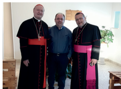
2017 - Visita del Cardinale Gianfranco Ravasi