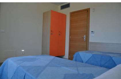
Una delle camere dell'accoglienza

La MENSA ha distribuito in media più di 190 pasti ogni giorno per un totale di 693.770 pasti dal 2013.