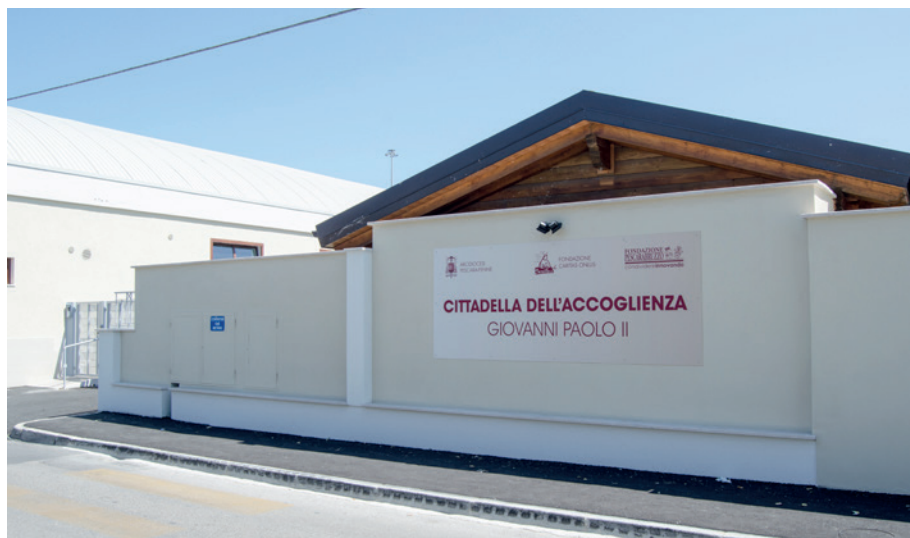
L'ingresso della Cittadella dell'Accoglienza Giovanni Paolo II