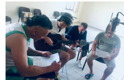
2020 - Un laboratorio del progetto POINT