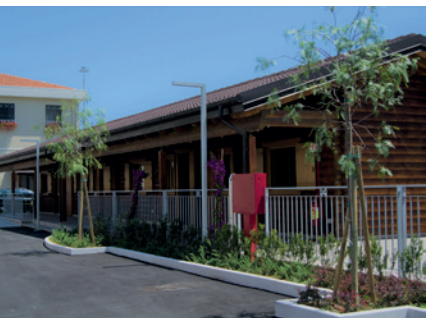
L'esterno di alcune strutture adibite all'accoglienza notturna