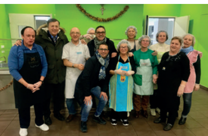
Un gruppo di volontari in servizio

L' ACCOGLIENZA NOTTURNA e la SECONDA ACCOGLIENZA hanno accompagnato e fornito alloggio e servizi a 1.935 persone tra uomini e donne dal 2013.