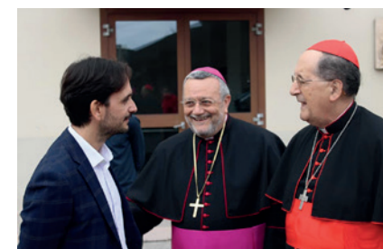
2021 - Visita del Cardinale Beniamino Stella