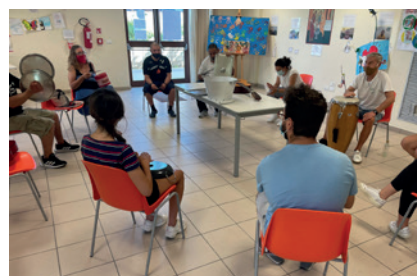
2021 - Un laboratorio con i ragazzi di Young Caritas