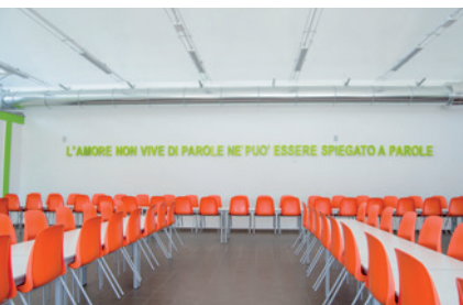
La sala mensa

Dal 2013 sono stati tanti i servizi offerti e le persone sostenute.