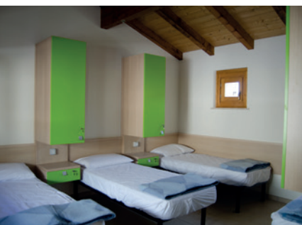
Una delle camere dell'accoglienza