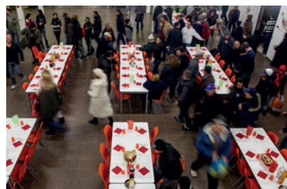
La sala mensa imbandita per un cenone di Capodanno