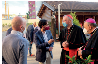
2020 - La visita del Cardinale Pietro Parolin