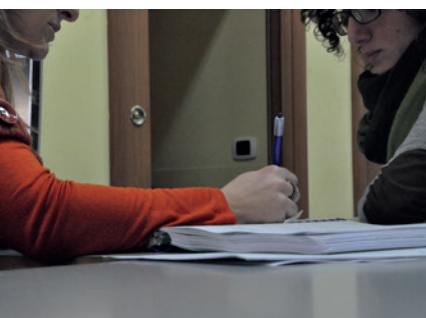
Un colloquio del Centro d'Ascolto