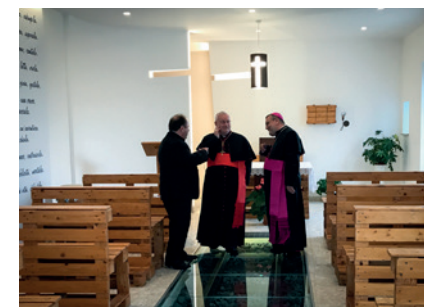
2017 - Visita del Cardinale Gualtiero Bassetti